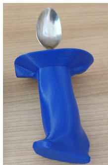
◀ Cuillère ergonomique

Certaines aides-techniques nécessitent un moulage pour une meilleure utilisation ou un meilleur maintien. Grâce au scanner 3D, nous pouvons réaliser un moulage virtuel puis modéliser des aides-techniques confortables, ultralégères et très fonctionnelles.